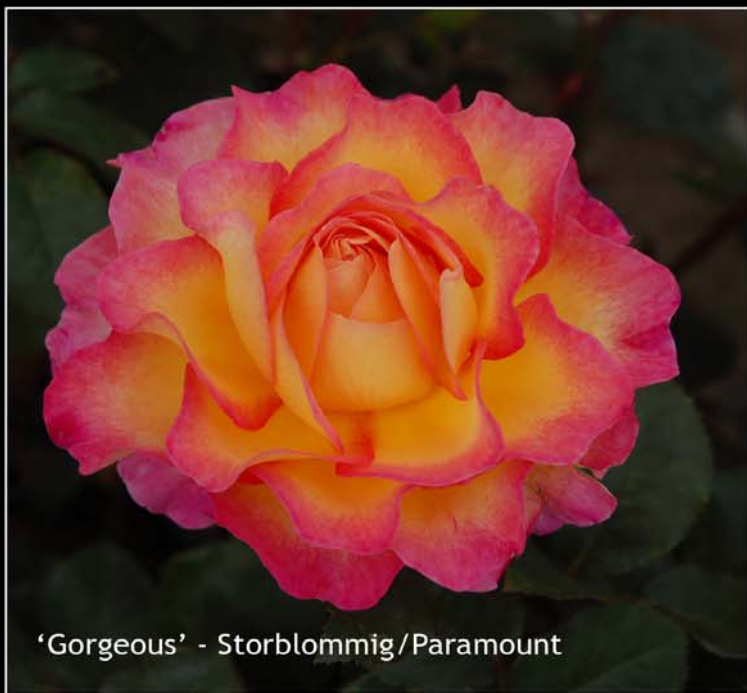
'Gorgeous' - Storblommig/Paramount