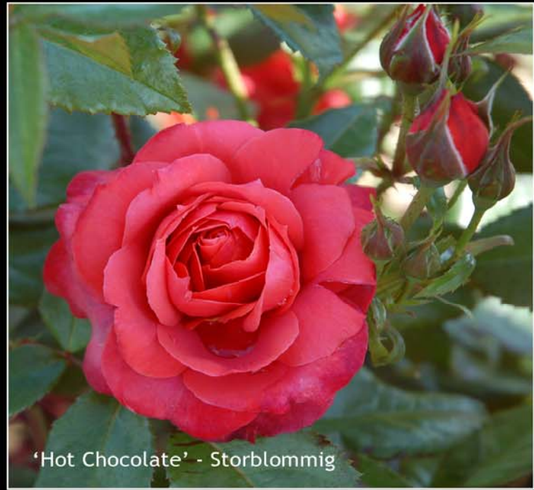
'Hot Chocolate' - Storblommig