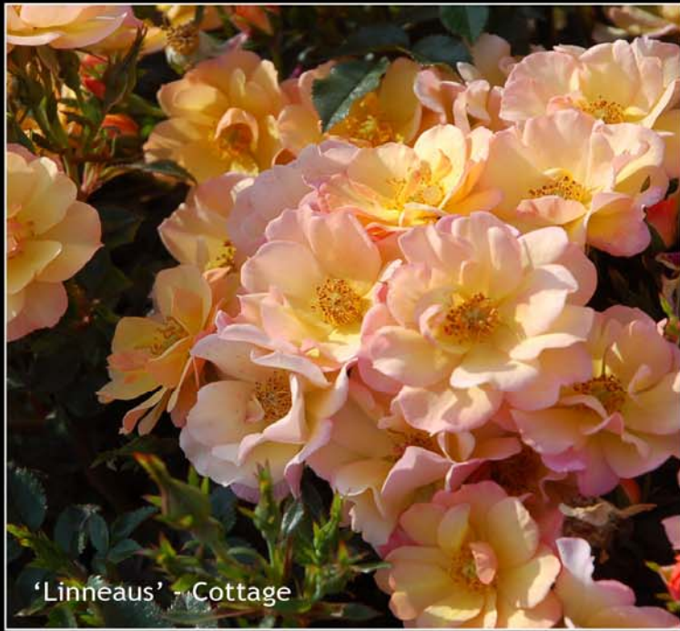
'Linneaus' - Cottage