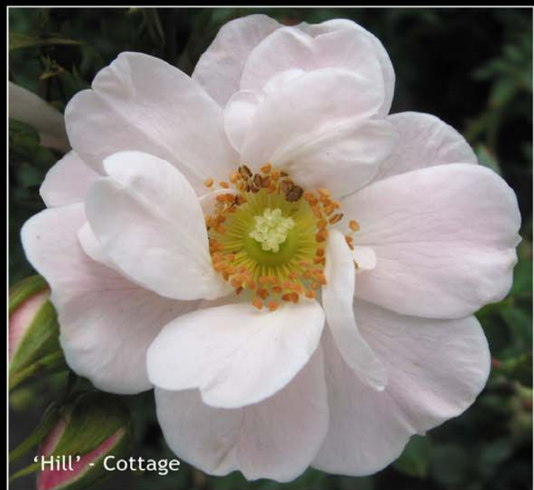
'Hill' - Cottage