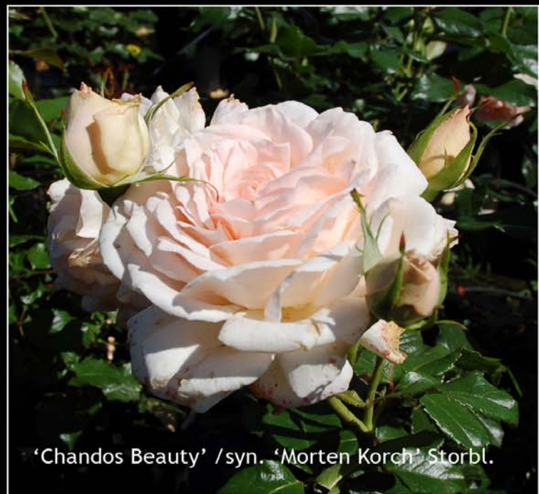
'Chandos Beauty' /syn. 'Morten Korch' Storbl.